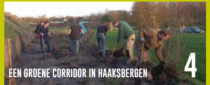
EEN GROENE CORRIDOR IN HAAKSBERGEN