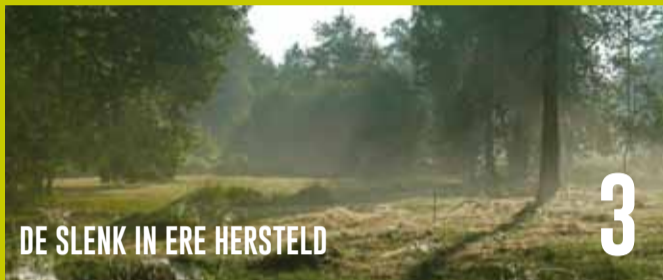
DE SLEK IN ERE HERSTELD