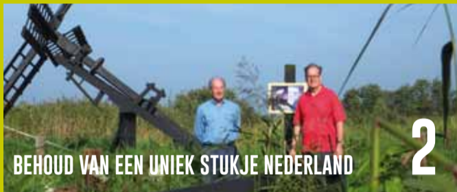
BEHOUD VAN EEN UNIEK STUKJE NEDERLAND