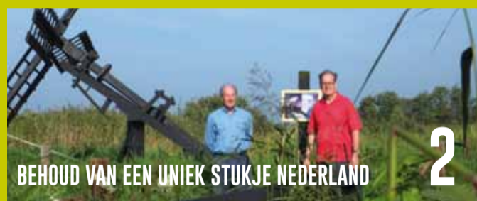
BEHOUD VAN EEN UNIEK STUKJE NEDERLAND