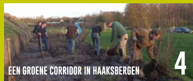
EEN GROENE CORRIDOR IN HAAKSBERGEN