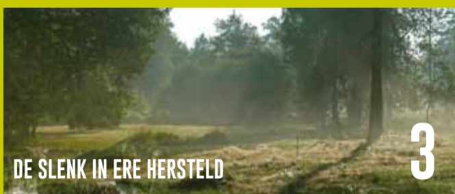
DE SLEK IN ERE HERSTELD